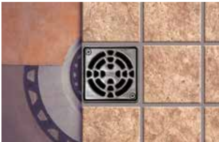
Assemblage du drain Schluter®-KERDI-DRAIN avec la membrane Schluter®-KERDI

E96 (procédure E à 90 % d'humidité relative). Schluter®-KERDI-DS est une membrane de 20 mil comportant des additifs, ce qui lui confère une perméabilité à la vapeur de 0.18 perm.